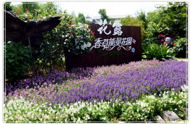
花露花卉休閒農場