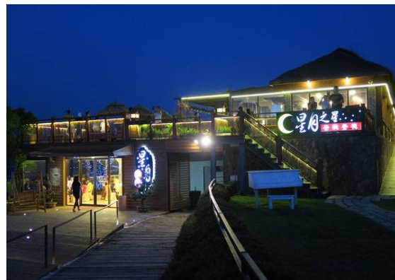
星月大地景觀餐廳