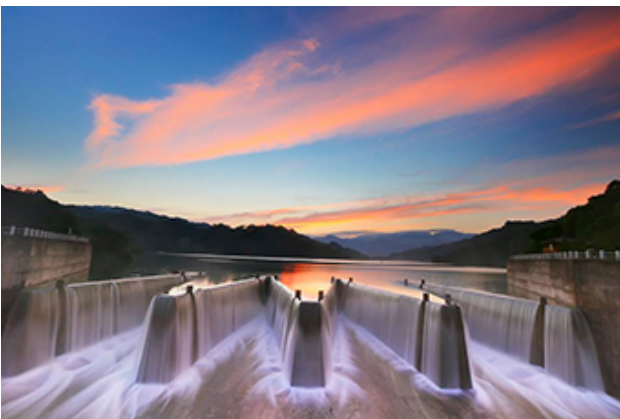
鯉魚潭水庫-鋸齒堰