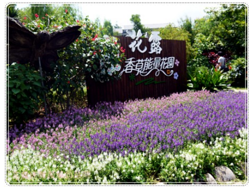
花露花卉休閒農場