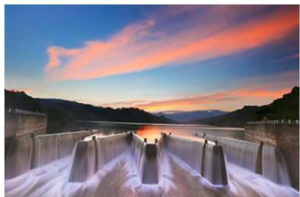
鯉魚潭水庫鋸齒堰