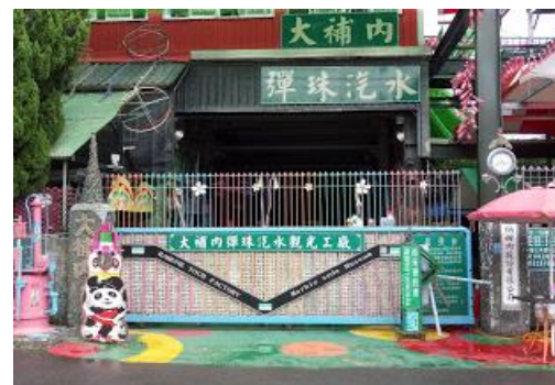
大埔內彈珠汽水工廠