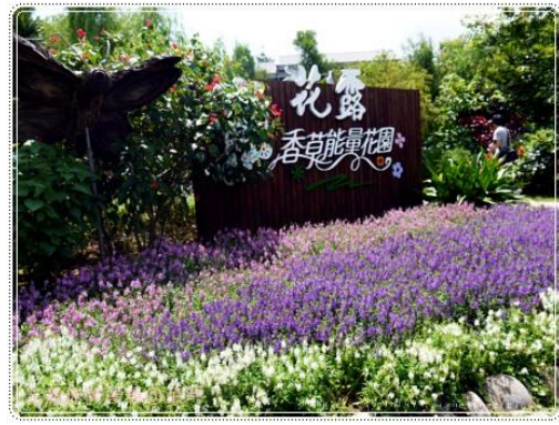
花露花卉休閒農場