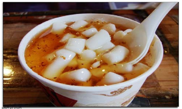
南庄必吃→桂花釀湯圓