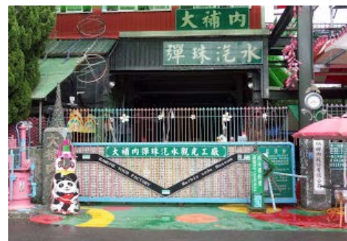
大埔內彈珠汽水工廠