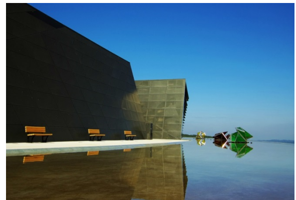
客家文化館-半月池