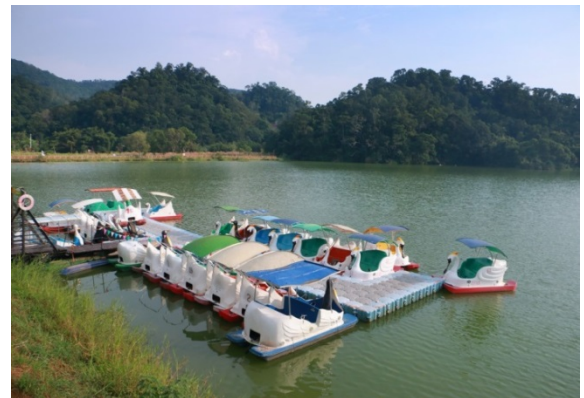
德興池(湖畔咖啡.天鵝船)