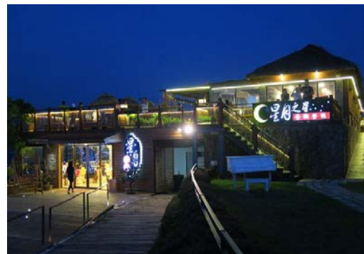
星月大地景觀餐廳