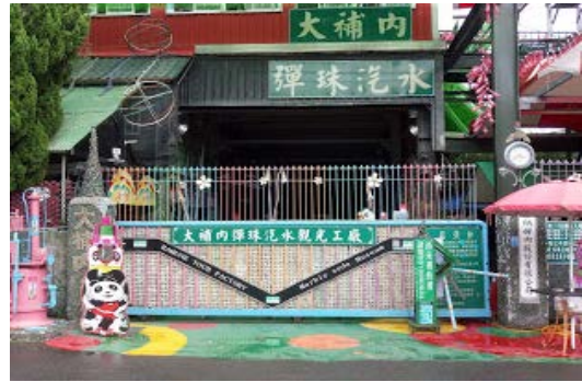
彈珠汽水觀光工廠